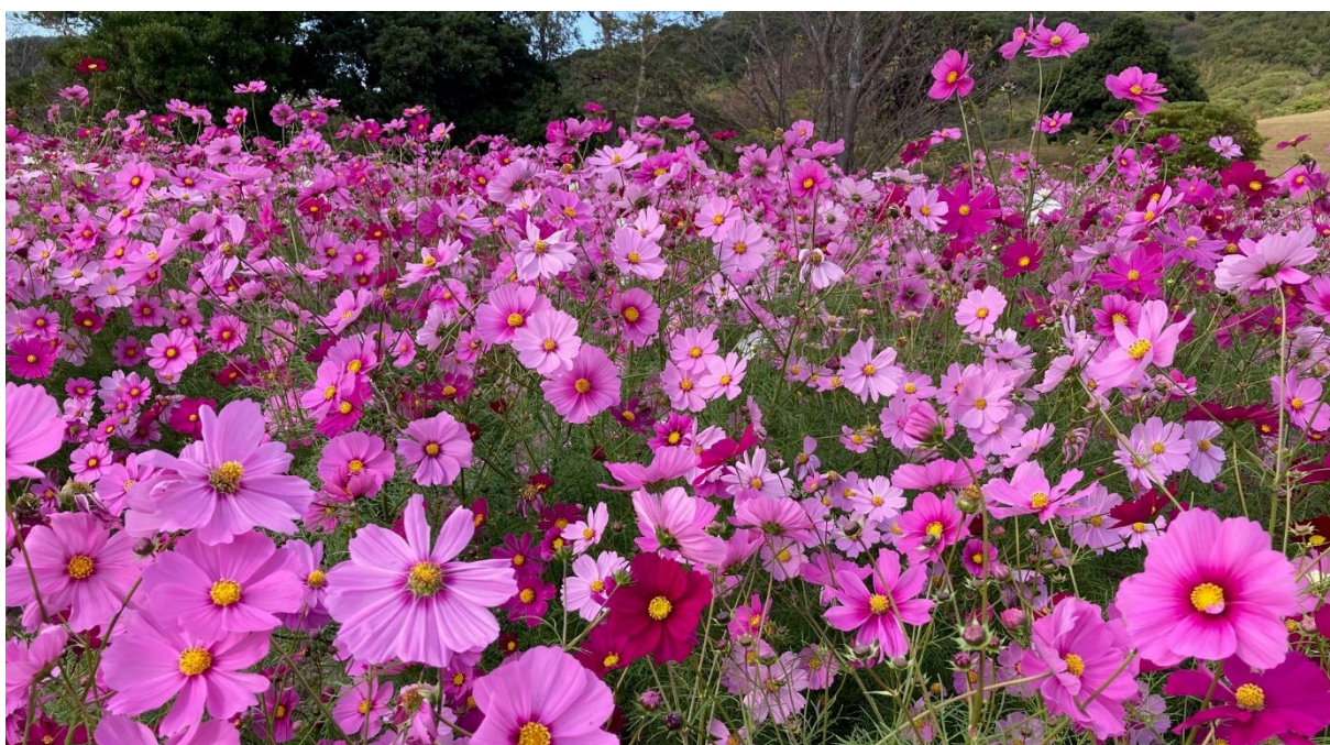
2023.10 淡路島イングランドの丘 咲きほこる大輪のコスモスに92歳の母の笑顔はまるで童女

2023年11月号のニュースレターをお届けします。 掲載内容についてご不明な点がありましたら、当事務所までお問合せください。